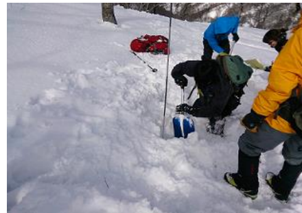
昨年度の雪崩講習 埋没者の捜